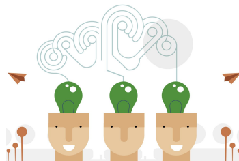
Creating and modifying digital resources